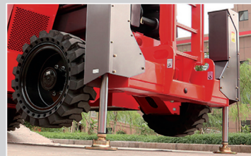
Automatische, selbstnivellierende Stabilisatoren