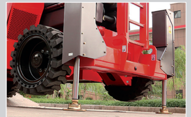
Automatische, selbstnivellierende Stabilisatoren